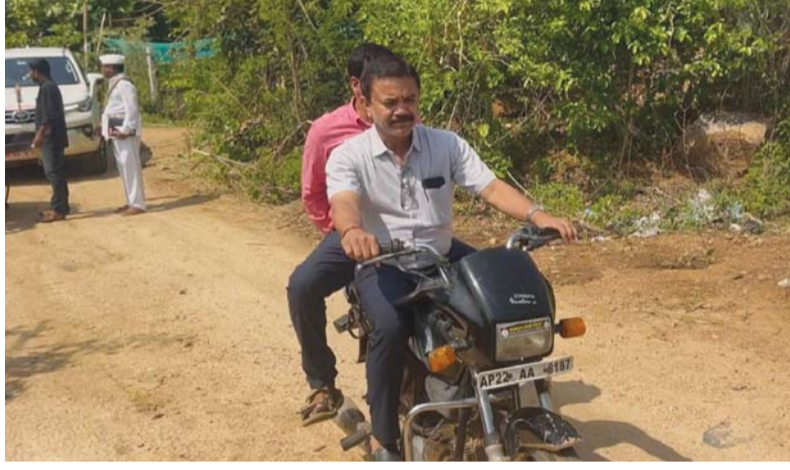
మహబూబ్ నగర్, (సమయం ప్రతినిధి): మహబూబ్ నగర్ మండలంలోని కోట కదిర, పోతనపల్లి, మాచనపల్లి గ్రామాల్లో శనివారం స్థానిక సంస్థల అదనపు కలెక్టర్