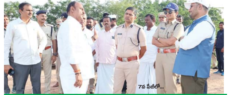
సీఎం పర్వతానకు పక్కాంటి ఏర్పాట్లు