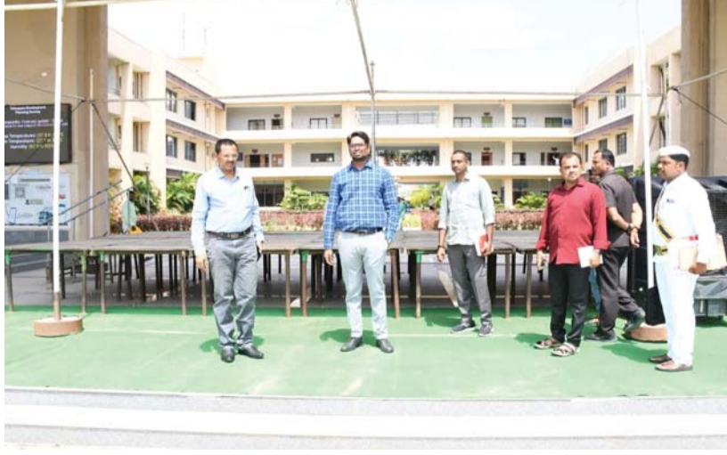
-జిల్లా కలెక్టర్ ఆదర్శ సురభి

వనపర్తి, సమయం ప్రతినది: జూన్ 2 తెలంగాణ రాష్ట్ర అవతరణ దినోత్సవ వేడుకలను ఘనంగా, సక్రమంగా నిర్వహించేందుకు పకడ్బందీ ఏర్పాట్లు చేయాలని జిల్లా కలెక్టర్ ఆదర్శ సురభి సూచించారు. సోమవారం జిల్లా కలెక్టర్ కలెక్టరేట్