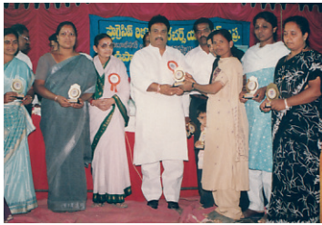
1990లో ఉపాధ్యాయులు జిల్లా ఆటల పోటీల సందర్భంగా వాణిజ్యో పోటీలో ఫస్ట్ ప్రైస్ ఎంపి జేతందరెడ్డి గారితో అందుకుంటూ..