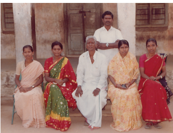
1995 సీపీఎస్ భూత్పూర్లో...