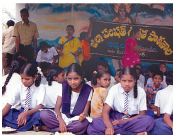
2010 సీసీ కుంటలో....