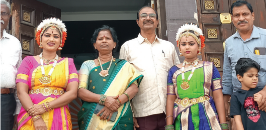
రవీంద్రభారతిలో మనవరాలి నృత్య ప్రదర్శన సందర్భంగా