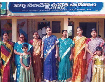
సీసీ కుంట పాఠశాలలో 2010 జనవరి సందర్భంగా సహచరులతో