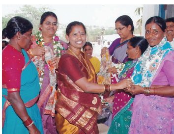
2009లో పీఎస్ భూత్పూర్లో వంటవారికి వీరల పంపిణీ