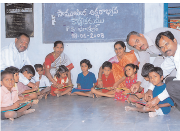
2008లో భూత్పూర్ పాఠశాలలో సామాజిక అక్షరాస్యత కార్యక్రమంలో..