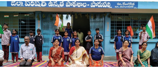
యోగా దినోత్సవం సందర్భంగా పాఠశాల విద్యార్థులకు యోగా కార్యక్రమాన్ని నిర్వహిస్తూ...