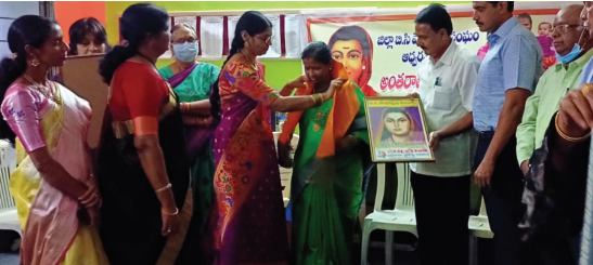
అంతర్జాతీయ మహిళా దినోత్సవం సందర్భంగా ఉత్తమ మహిళా ఉపాధ్యాయునిగా పురస్కారం పొందుతూ