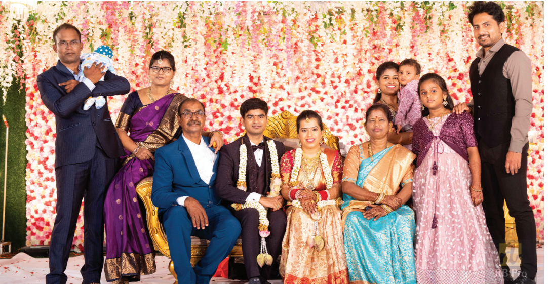
కుమారుని వివాహం సందర్భంగా కుటుంబసభ్యులతో...