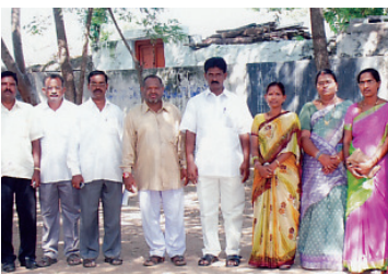
అప్పటి పీఆర్డీయూ రాష్ట్ర అధ్యక్షుడుతో భూత్పూర్ యూపిఎస్లో ఉపాధ్యాయ బృందం