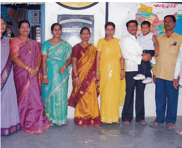
2009 పీఎస్ భూత్పూర్లో...