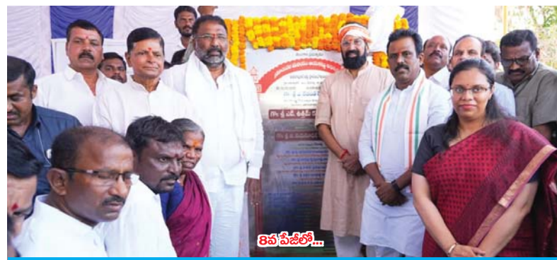
పాలమూరు జిల్లా పెండింగ్ ప్రాజెక్టులను పూర్తిచేస్తాం: మంత్రి ఉత్తమ