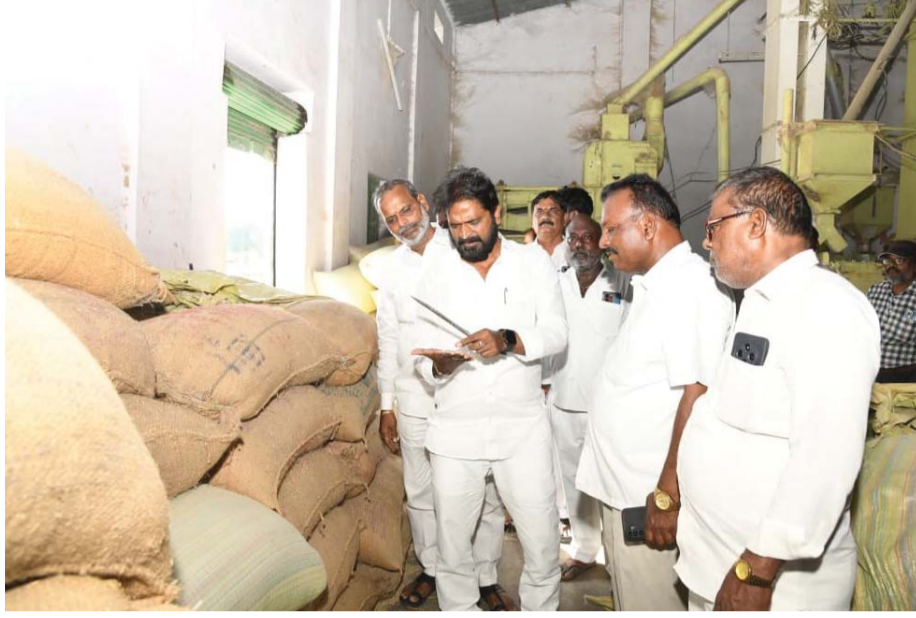
-పాలన ఇలాగే కొనసాగితే రైతుల పక్షాన పోరాటం చేస్తాం మాజీ మంత్రి శ్రీనివాస్ గౌడ్ పిలుపు

సమయం ప్రతినిధి మహబూబ్ నగర్: మహబూబ్ నగర్ మండల పరిధిలోని మిల్లు ను పరిశీలించి రైతులతో మాజీ మంత్రి శ్రీనివాస్ గౌడ్ మాట్లాడారు. రైతులను కదిలిన కన్నీళ్లు పెట్టుకుంటున్నారని ప్రభుత్వం పంట కొనుగోలు చేయక పోవడం