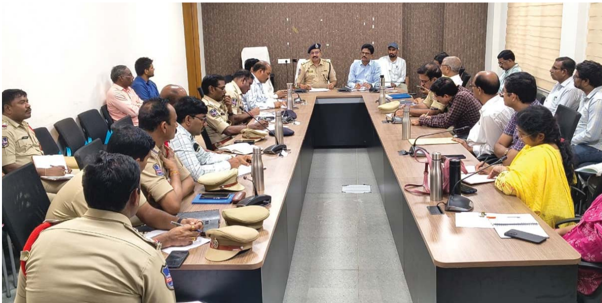
చేయడం జరిగిందని, బాధితులకు సేవలు అందించడం చేపట్టాలని తెలిపారు. జిల్లా సంక్షేమ శాఖ ఆధ్వర్యంలో జరుగుతుందని తెలిపారు. వ్యవసాయ శాఖ ఆధ్వర్యంలో పాఠశాలలు, కళాశాలలో విద్యార్థులకు అవగాహన కల్పించేందుకు ప్రత్యేకంగా సిబ్బందిని ఏర్పాటు చేయాలని