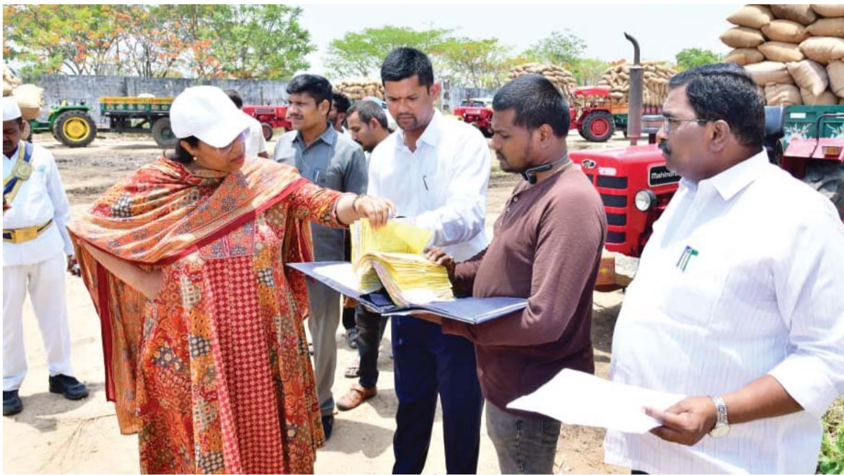
వెంటనే ఏర్పాటు చేసి ధాన్యం సంచులను తక్షణమే మిల్లులకు మిల్లుల వద్ద ధాన్యం సంచుల అన్ టోడింగ్ ప్రక్రియను తరలించేలా చర్యలు తీసుకోవాలని ఆదేశించారు. అలాగే వేగవంతం చేయాలని, బ్రాక్ షీట్ వివరాలను ఓపీఎంఎస్