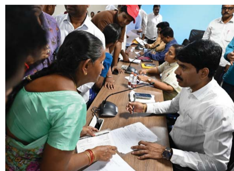
కంటే ఎక్కువ కాలం నిల్వ ఉండకూడదని హెచ్చరించిన ఆయన, ఎక్కడైనా ఉల్లంఘనలు గమనిస్తే సంబంధిత అధికారులపై చర్యలు తీసుకుంటామని స్పష్టం చేశారు.