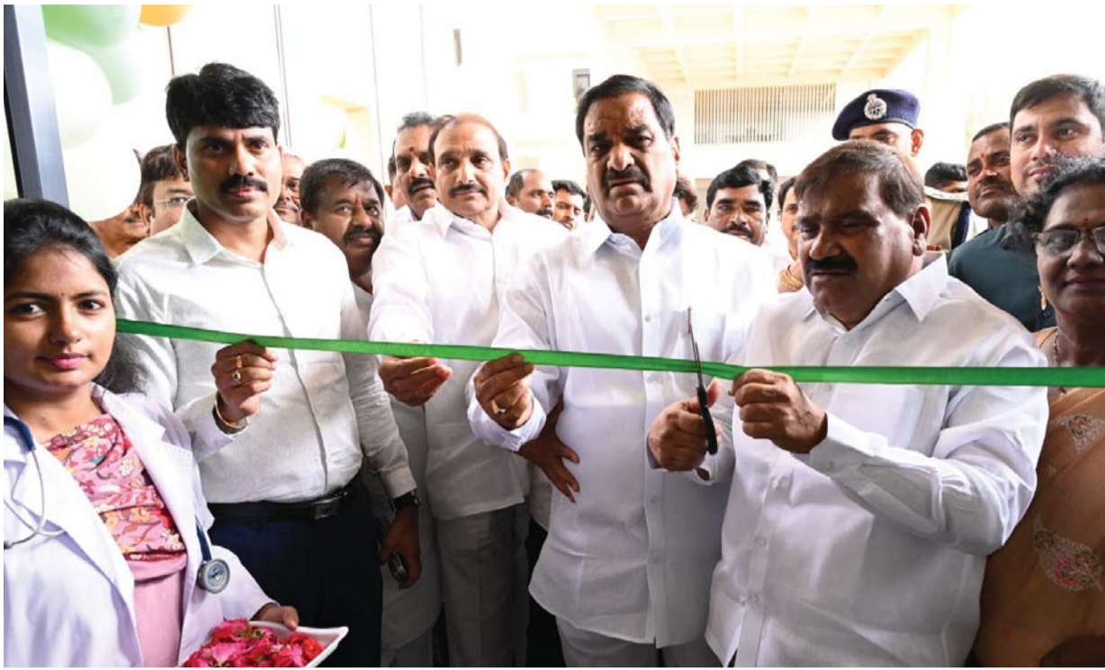
పనిచేస్తోందని, సీఎం రేవంత్ రెడ్డి ప్రజా సమస్యల పరిష్కారమే ధ్యేయంగా ప్రజాపాలన-ప్రగతి ప్రణాళిక కార్యక్రమాన్ని ప్రారంభించారని చెప్పారు. గత రెండేళ్లలో రంగారెడ్డి జిల్లాలో అభివృద్ధి వేగంగా జరిగిందని పేర్కొన్నారు. జిల్లాలో 2 లక్షల 97 వేల మంది రైతులకు రూ. 722 కోట్ల రైతు భరోసా అందించామని, రైతు బీమా కింద 735